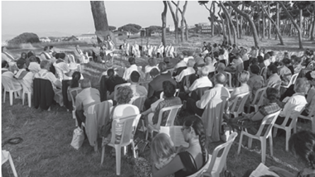
La misa final al aire libre

la cumbre de la ONU para la adopción de la “Agenda para el Desarrollo después de 2015” en septiembre y la “vigésima primera reunión de la Conferencia de las Partes en la Convención Marco sobre el cambio climático de las Naciones Unidas (COP21)” a finales de año en París. La encíclica tendrá un impacto seguro en estos eventos, pero su anchura y profundidad van mucho más allá de su contexto en el tiempo.